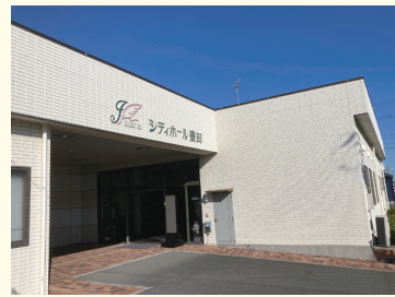
▲シティホール豊田

人が亡くなると、家族はとて悲しくどうしたらよいか分からなくなります。まずは何をしたらよいかを伝え、要望を聞きながらお葬式の形を整えていきます。大切な人を亡くした悲しみに寄り添いながら、最後のお別れができるよう式の準備や会場の設営、進行などを行います。お葬式の後も困らないように相談にも応じます。亡くなった人と、その家族の気持ちを大切にしながら「ありがとう」を伝えるお手伝いをする仕事です。