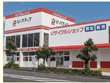
▲ピックアップ磐田店

静岡県内14店舗を展開するリユースショップで、家具や家電、衣類、ブランド品、楽器など、さまざまな中古品を買い取り、きれいにクリーニングや整備をしたものを、店頭やインターネットで販売しています。物を買ったり売ったりするだけでなく、「まだ使える」「まだだれかの役に立つ」品物として、次に使う人につないでいます。物を大切にする気持ちや、無駄を減らす暮らしを広げていくことも大切な役割だと考えています。