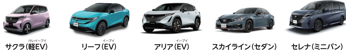
サクラ(軽EV) リーフ(EV) アリア(EV) スカイライン(セダン) セレナ(ミニバン)

ガソリンの必要ない電気自動車(EV)や、小回りのきく軽自動車が人気です。家族が多いとミニバンも購入するお客様が多いです。使う目的によってさまざまな車種を提案します。