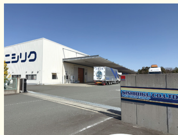
ちゅうぶ してん ▲中部支店

くるま 車、バイク、ボートからピアノなどの楽器まで、さまざま な商品を特殊車両などで、工場から全国へ配送してい ます。お客さまの商品に合わせた要望を聞き、一番効率 の良い輸送方法を提案して、安全で正確な倉庫保管や 全国各地への輸送を行います。特別な運搬技術を身に つけたスタッフが、真心こめてスピーディかつ安全に運搬して います。また、太陽光発電所の太陽光パネルの洗浄もしています。